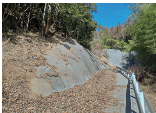
①-2 山際公園西露頭の現況