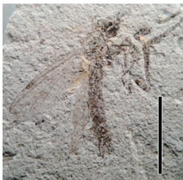
②-2 SNM-F-Kb-426a Dilophus sp. トゲケバエ属