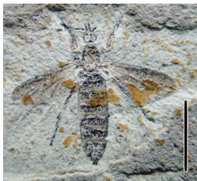
②-1 SNM-F-Kb-402 Bibio sp. ケバエ属