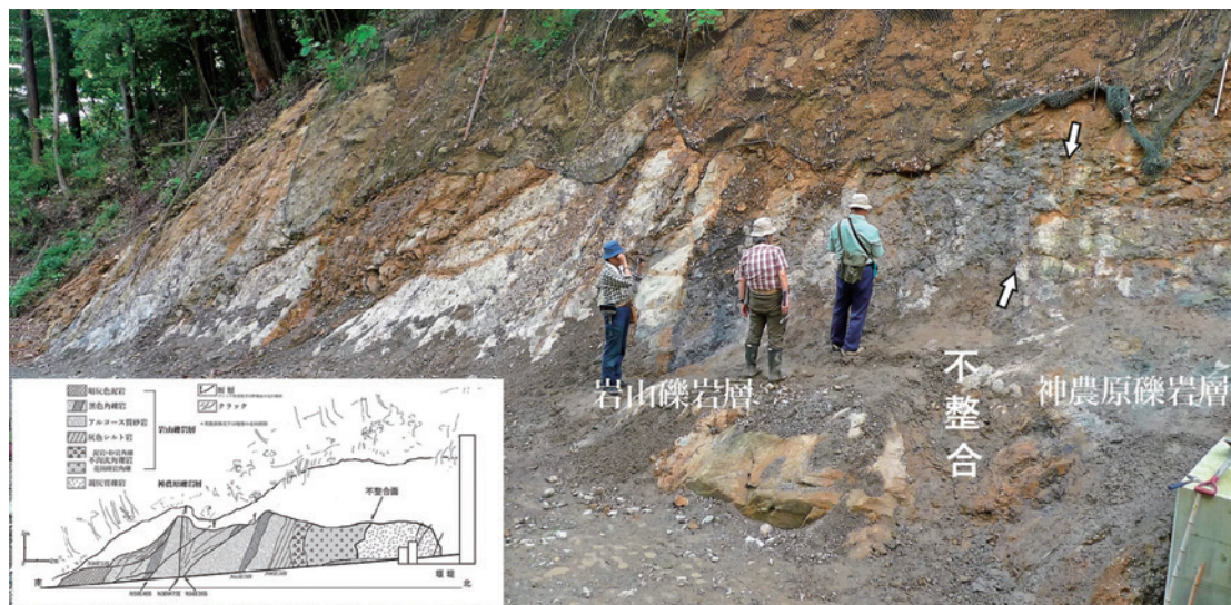
①-1 山際公園西の堰堤脇 不整合露頭