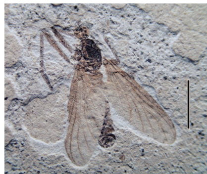
②-3 SNM-F-Kb-395 Plecia sp. トゲナシケバエ属